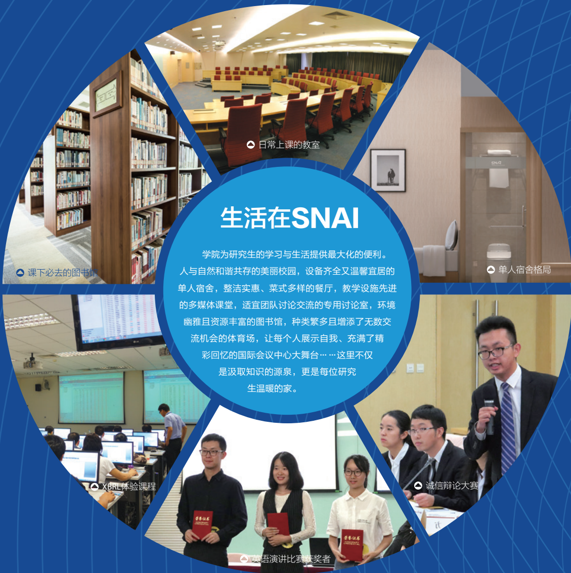
◀ 课下必去的图书馆