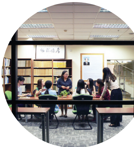
课下的案例研讨热烈依旧