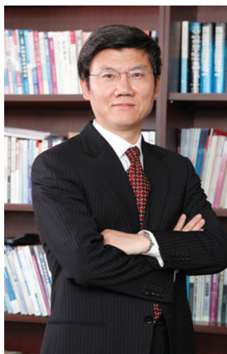
上海国家会计学院 院长