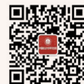
研究生院 微信公众平台