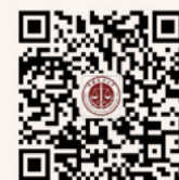
中国政法大学 微信公众平台