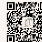
研究生迎新 微信公众平台