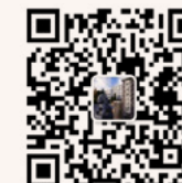
研招办 微信公众平台