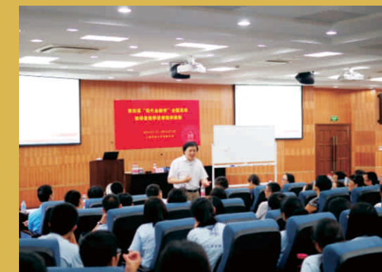
美国康奈尔大学金融学终身教授黄明主题演讲

作为金融学院的品牌讲座，毓秀讲堂将校友、兼职导师的智慧、经验、才智汇集起来，为在校学生开阔视野、增长见识。目前担任金融学院校外研究生导师的社会各界校友、金融界精英人士多达150人左右，他们广泛分布在金融工作的一线，将主导毓秀讲堂，引领金融学子“广结天下百家，博闻诸子争鸣”。