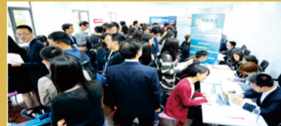
2016金融企业暑期 实习校园招聘

职业发展咨询： 专职职业发展老师为学生提供就业、实习等方面的辅导，实时发布最新的独家招聘职位，一对一进行面试辅导及后续跟踪，全面提高我院学生的竞争力。