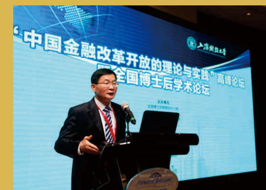
中国人民银行调查统计司司长盛松成教授主题演讲