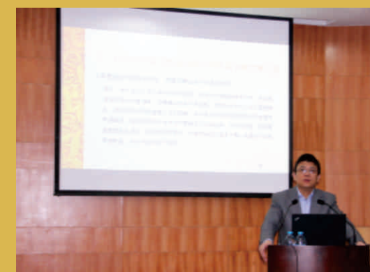
原上海市人民政府发展研究中心主任肖林教授主题演讲