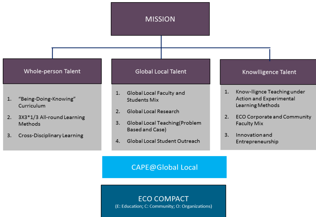
图 1：SHU MBA 模式

2009年，SHU MBA 获得全国 MBA 教育指导委员会 5、6 批高校评估中第 6 小组综合得分第一。“SHU MBA 模式”得到国内官方与权威评审的认可。另一方面，从 2004 年至今，SHU MBA 总共录取 1769 名学生，有 1194 名校友。根据 2013 年的任职调查显示，他们中毕业生毕业时薪资较入学前增长 50%，部分校友毕业三年后薪资增长达到 200%。