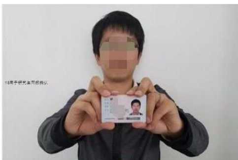
(手持身份证照样例)

3.本人 身份证原件正反面照 （分正、反面两张上传， 请确保身份证边框完整，字迹清晰可见，亮度均匀 ）。