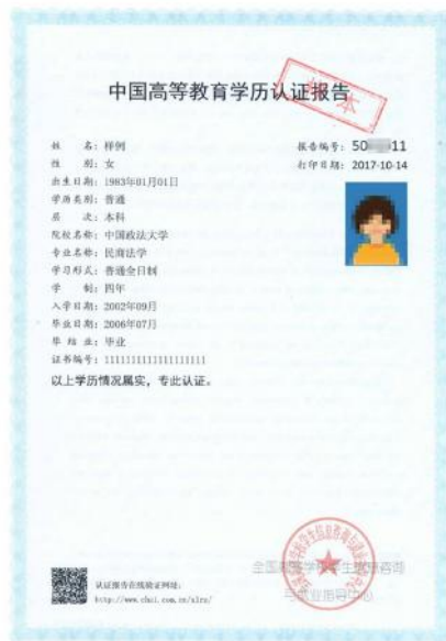
《中国高等教育学历认证报告》 样例

6. 未取得毕业证（2022 年入学前可取得毕业证）的高等教育自学考试本科生，须提供 自考生准考证 （丢失准考证的，由考籍所在省自考办出具考籍证明或成绩证明）。