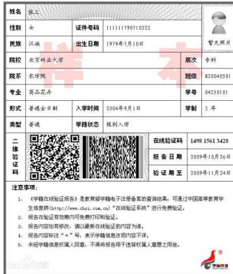
教育部学籍在线验证报告

5. 天津户籍未取得毕业证（2021 年入学前可取得）的高等教育自学考试本科生，须提供（1）自考生准考证；（2）户口本首页、索引页以及个人单页（集体户口仅提供首页及个人单页）。