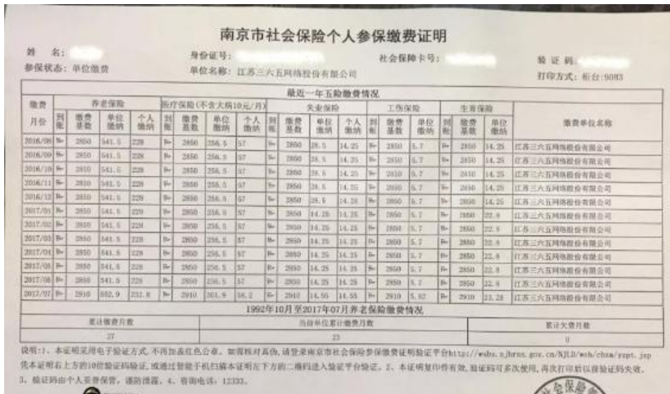
南京市参保证明示例