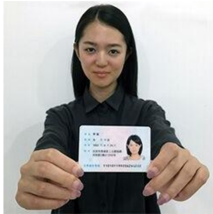
手持身份证照片示例