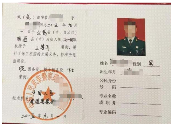
退出现役证照片示例