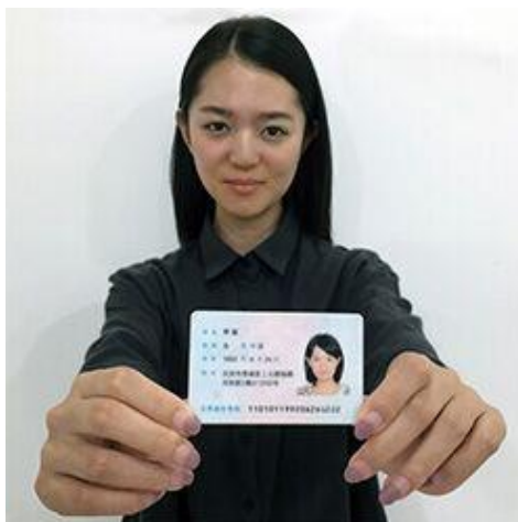
手持身份证照片示例