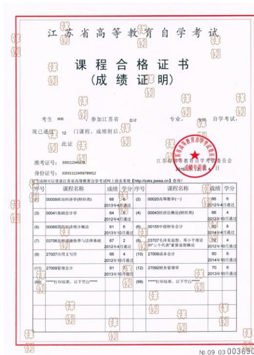
成绩证明照片示例

2. 网报时未通过学历(或学籍)校验的, 须上传教育部的电子注册备案表(2002年以后毕业的往届生)或学历认证报告(2002年以前毕业的往届生)或学籍在线验证报告(应届生)。